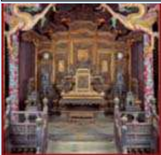
Il trono di Mukden

Dal 29 ottobre al 13 maggio 2012 la Fondazione Cassamarca, sotto l'alto patronato del Presidente della Repubblica Italiana e con il patrocinio del Comune di Treviso, ospiterà presso la Casa dei Carraresi di Treviso una mostra che riguarderà la Dinastia Manciù che ha governato sul Celeste Impero dal 1644 al 1911, l'ultima di quattro mostre che completa il ciclo "La Via della Seta e la Civiltà Cinese" ospitate a Casa dei Carraresi.