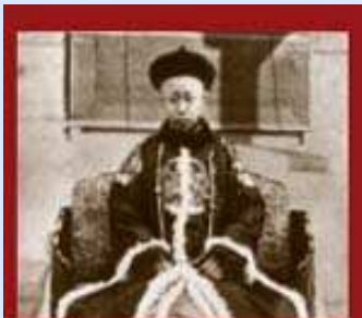
L'imperatore bambino Pu Yi