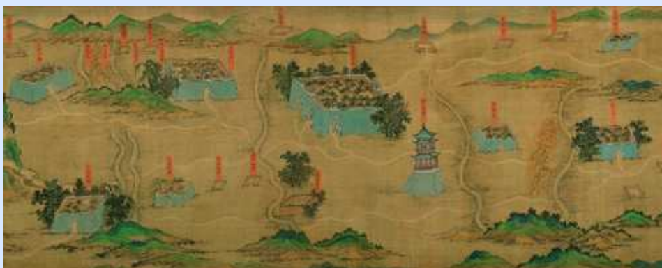
Un particolare della Carta del paesaggio mongolo esposta alla mostra

Una delle dieci mostre allestite a Roma nell'ambito della Biennale Internazionale di Cultura Vie della Seta