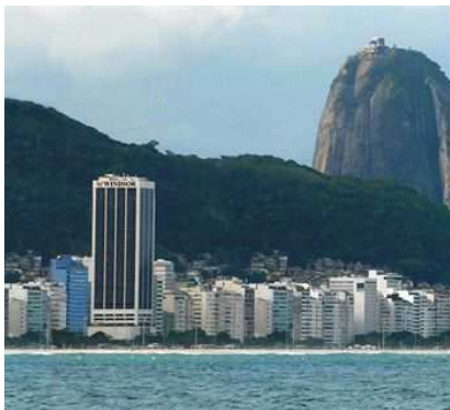
In primo piano, il grattacielo dell'Hotel Windsor Atlantica, sede del meeting della Commission on Taxation.