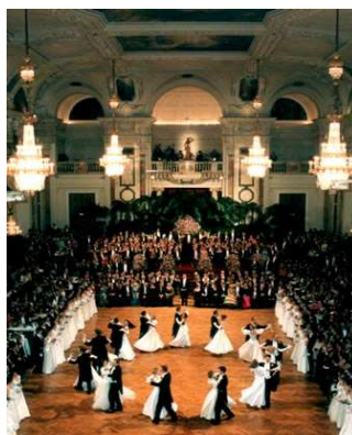
Vienna – "Juristenball"