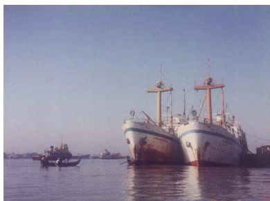
Navi nel porto di Chittagong (Bangladesh), il più pericoloso al mondo secondo il rapporto IMB

Secondo un recente studio condotto dall' International Maritime Bureau (IMB) della ICC, gli attacchi di pirateria segnalati a livello mondiale sono in diminuzione. Le statistiche attestate nell'ultima edizione del rapporto dell'organizzazione con sede a Kuala Lumpur, rapporto dal titolo “ Piracy and Armed Robbery Against Ships ”, rivelano che il numero di attacchi