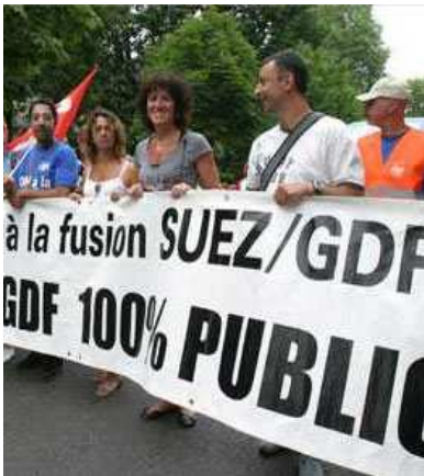
una manifestazione francese neo-protezionista

Con una dichiarazione di indirizzo redatta congiuntamente dalla Commissione internazionale della ICC sulle politiche del commercio e degli investimenti e dalla commissione internazionale sui servizi finanziari e assicurativi, la ICC invita i governi a riaffermare il loro impegno in favore della liberalizzazione del mercato degli investimenti esteri.