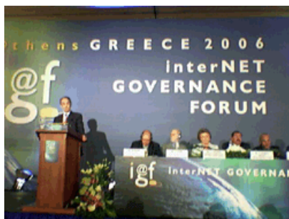
Guy Sebban al forum Igf

Una maggiore partecipazione di tutte le parti in causa in condizioni di parità è il modo migliore per sviluppare una "società dell'informazione per tutti". Così il Segretario generale della ICC Guy Sebban si è espresso il 30 ottobre alla sessione di apertura del primo Internet Governance Forum (IGF) di Atene. Sebban ha sottolineato come il forum sia "una opportunità per incoraggiare un dibattito più vasto, condividere le informazioni e promuovere una più ampia rete di relazioni fra imprese, governo, società civile, esperti e organizzazioni intergovernative in ambito di information society ". La ICC ha partecipato all'IGF forte della sua autorevole e principale voce del mondo delle imprese, facendo conoscere la recente iniziativa Business Action to Support the Information Society (BASIS). Nel corso delle sessioni principali del forum, una delegazione della ICC formata da leader d'azienda di vari paesi ha segnalato le necessità degli operatori delle imprese, tra cui libertà di espressione su Internet;