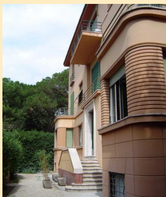
La nuova sede di ICC Italia

Intensi i lavori della Commissione questioni fiscali di ICC Italia, che si è riunita in sede il 9 novembre sotto la presidenza del Prof. Avv. Victor Uckmar.