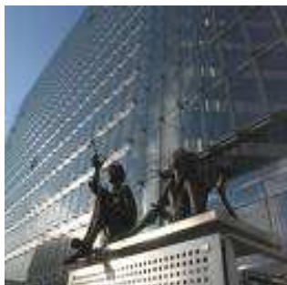
Bruxelles — Sede della Commissione Europea

Si è svolto nei giorni scorsi a Bruxelles un incontro che ha