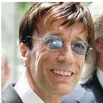
Robin Gibb, ex cantante dei Bee Gees

Un summit mondiale sul diritto d'autore: è quanto organizza la Bascap ( Business Action to Stop Counterfeiting and Piracy ) della ICC per il 7-8 giugno a Bruxelles. Parola d'ordine del summit è "Creare valore nell'economia digitale" e riflette